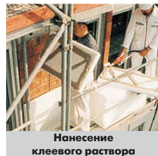
Нанесение клеящего раствора