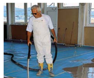
Наливные бесшовные полы