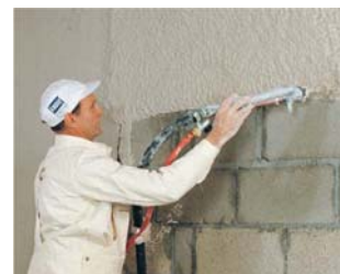
Внутренние штукатурные работы