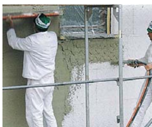
Наружные штукатурные работы