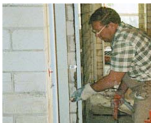
Заделка дверных коробок раствором